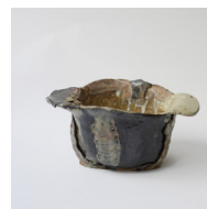
poche , 2023 H13 × L25 cm 1,5 kg différents grès, émaux et cendres, 300 —