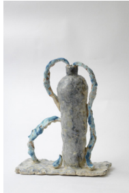
fontaine grise (pleureuse n°4), 2023 H33 × L27 × P13 cm 2,2 kg grès blanc chamotté, engobes, émaux, 850 —