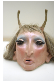
guest 7, quocoubeh , 2023 H28 × L23 × P25 cm 2 kg grès, maquillage, perruque et faux cils 1000 —