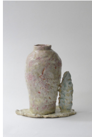
revoir un printemps , 2023 H27 × L25 cm 2,5 kg grès blanc chamotté, engobes, émail de cendres, 750 —