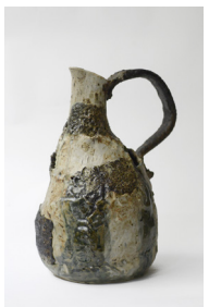
panse , 2023 H37 × L19 × P25 cm 3,5 kg différents grès, engobe de marne, émaux et cendres 1200 —