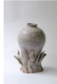
les filles du feu , 2023 H27 × L15 cm 3,5 kg grès blanc chamotté, engobe, émail de cendres, 750 —