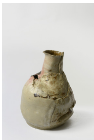
pli , 2023 H25 × L17 cm 2 kg différents grès, engobe de marne, émaux et cendres, 600 —