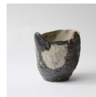
sac , 2023 H16 × L15 cm 1,1 kg différents grès, émaux et cendres, 300 —