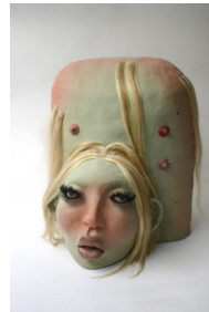
ma belle , 2022 H37 × L31 × P30 cm 5 kg grès émaillé, maquillage, perruque et faux cils 1500 —