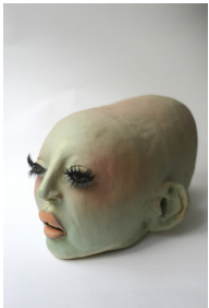
guest 1, tête longue crâne vide , 2022 H19 × L26 × P39 cm 3,9 kg grès émaillé, maquillage, faux cils 1200 —