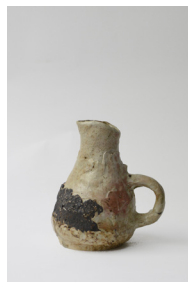
gosier , 2023 H22 × L19 cm 1,2 kg différents grès, émaux et cendres, 400 —