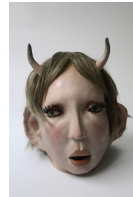
guest 6, la cornue , 2022 H28 × L20 × P25 cm 2,2 kg grès, maquillage, perruque et faux cils 1000 —