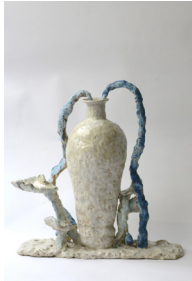
fleur de serre (pleureuse n°5), 2023 H44 × L41 × P13 cm 5 kg grès blanc chamotté, engobes, émaux, 1200 —