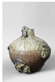
groutte , 2023 H26 × L27 cm 3,6 kg différents grès, émaux et cendres, 900 —