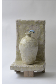
rendez-vous à Pompéi , 2023 H42 × L22 × P21 cm 8-10 kg ensemble de deux pièces en grès blanc chamotté, engobes, émaux, 1400 —